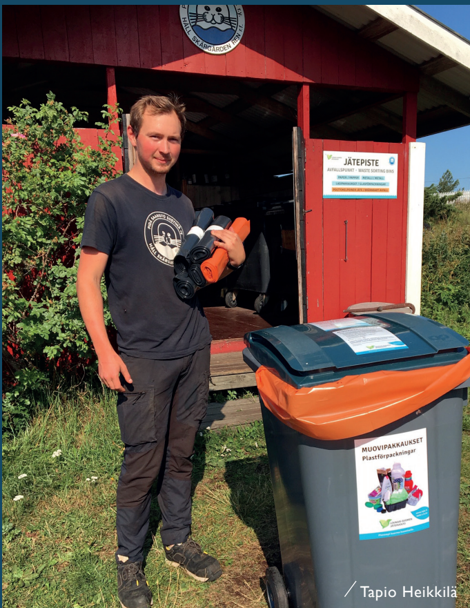
Bioavfall och plastförpackningar samlas nu in i Skärgårdshavet och Bottniska viken.