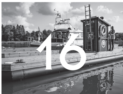
I SÄLLES SÄLLSKAP