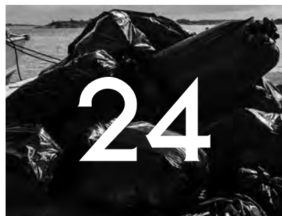
VÅR GEMENSAMMA MILJÖ