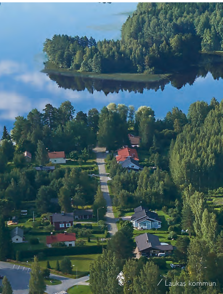
/ Laukas kommun

De fantastiska insjölandskapen har lockat besökare ända sen den kammeramiska tiden.