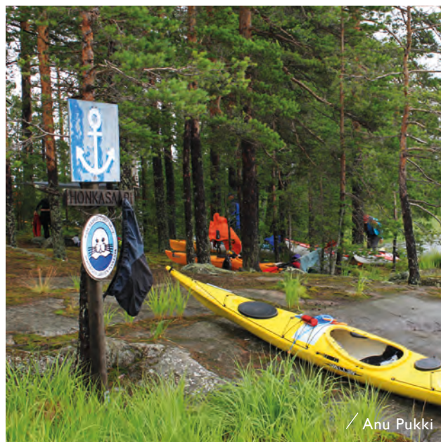
／ Anu Pukki

En av Själs viktigaste sevärdheter är träkyrkan från 1734 och den fristående klockstapeln.