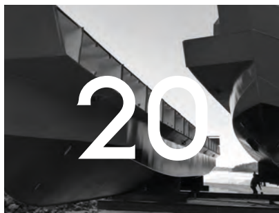
I SÄLLES SÄLLSKAP