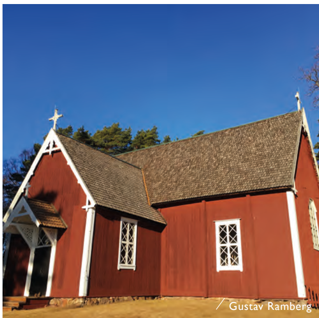
／ Gustav Ramberg

En av Själs viktigaste sevärdheter är träkyrkan från 1734 och den fristående klockstapeln.