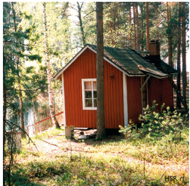
På Rokansaaris vindlande stigar känns historiens vingslag