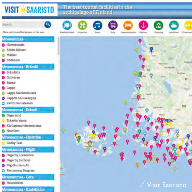
Skärgårdens och kustens turismtjänster på ett och samma ställe.

Serien presenterar och ger tips om intressanta besöksmål inom HSR rf:s verksamhetsområden