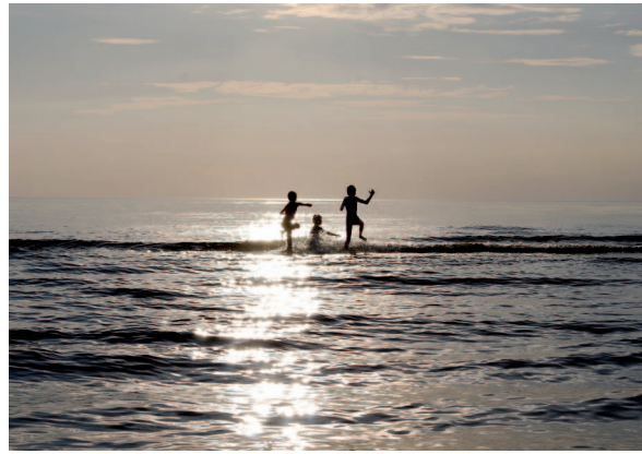
Bilderna är vinnarbilderna från Baltic Sea in My Eyes-fotografitävlingen som ordnades av BSNI-projektet.

grillplatsen med tak på Mässkär och uppförde en kokkåta på Tankar.