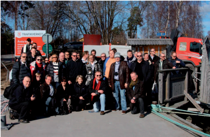
Det årliga Hamnar och miljö-seminariet ordnades ombord M/S Viking Mariella och på Utö i Sverige.

euro. Projektet startade i maj 2012 och avslutas officiellt i november 2013.