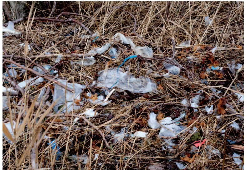
Eleverna från högstadiet i St. Karins städade, som en del av Marlin-projektet, simstranden i Hovirinta tre gånger år 2012. Till höger skräp från undersökningstranden i Björkö i Pargas våren 2012.

Huvudpartner är Stiftelsen Håll Sverige Rent och övriga medverkande vid sidan av HSR rf Hoia Eesti Merd från Estland och FEE Latvia från Lettland. Samtliga organisationer hör också till nätverket Keep Baltic Tidy, som bildades 1993 och som i sin tur är medlem i Östersjörådet (CBSS).